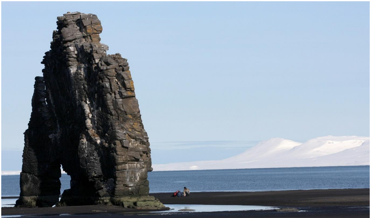
Mynd 2. Hvítserkur.

Sérstakt og ævintýralegt útlit Hvítserks hefur leitt af sér þjóðsögu og segir sagan að Hvítserkur sé steinrunninn tröllkarl sem bjó norður á Ströndum og vildi brjóta niður kirkjuklukkur Þingeyraklausturskirkju. Leiðin var torsóttari en hann gerði ráð fyrir og þegar sólin reis um morguninn hafði honum ekki tekist að ljúka ætlunarverki sínu og breyttist hann því í stein er hann leit fyrstu sólargeislana.