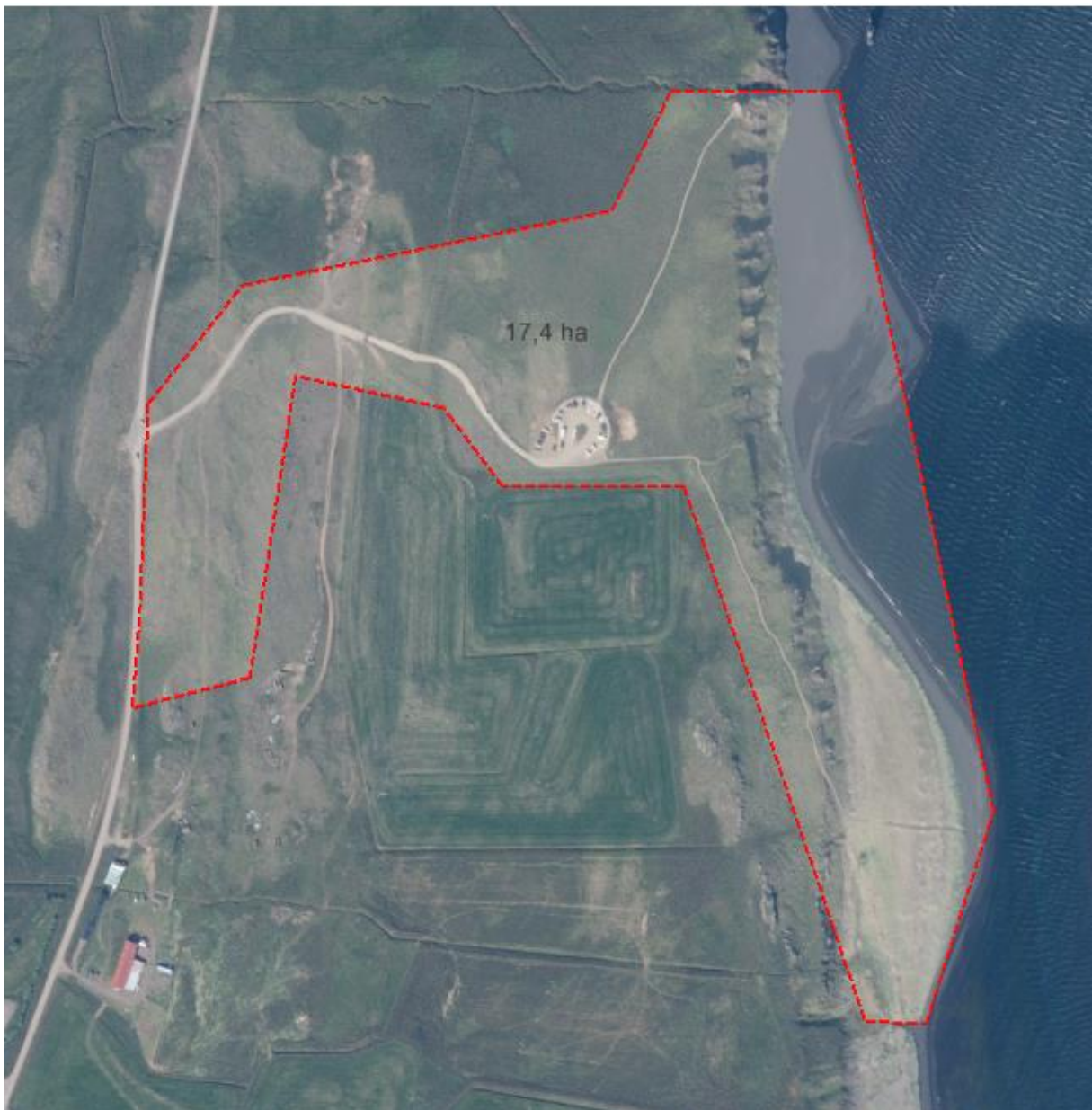
Mynd 1 Skipulagssvæðið, rauða línan sýnir mörk skipulagssvæðis.

Deiliskipulag þetta er ekki matsskytt samkvæmt reglugerð 66/2015 um mat á umhverfisáhrifum.