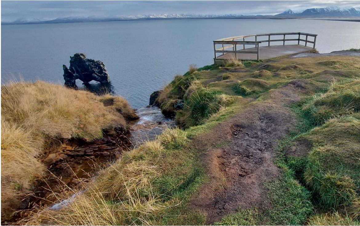
Mynd 4. Á myndunum má sjá hvernig svæðið í kringum útsýnispallinn er orðið traðkað niður. Mynd frá 2022