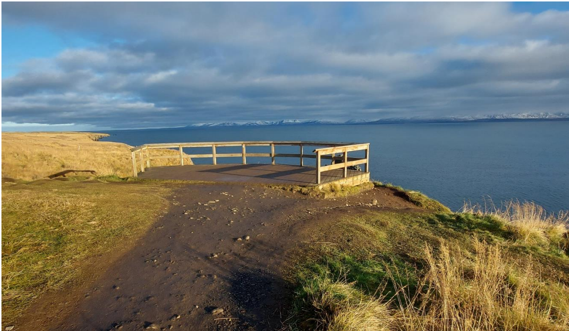
Mynd 3. Útsýnispallur fyrir ofan Hvítserks. Mynd frá 2022.

Vatnsnesvegur liggur að Hvítserki. Á deiliskipulagssvæðinu er bílastæði, göngustígar og útsýnispallur. Miðað við mikinn fjölda gesta og aukningu þeirra milli ára eru núverandi innviðir ekki alls nægir til að sinna þeirri umferð sem er um svæðið. Bílastæðið annar ekki þeirri bílaumferð sem nú er um svæðið, bílar leggja gjarnan utan við stæðið. Tveir göngustígar liggja frá bílastæði, annar til suðurs og hinn til norðurs að útsýnispalli. Útsýnispallurinn er lítill og svæðið í kringum hann mikið traðkað niður. Frá útsýnispalli er troðinn stígur niður bratta hlíðina niður í fjöru. Sá stígur er torfær og getur verið háll og er mikið notaður af gestum sem vilja komast í návígi við Hvítserk.