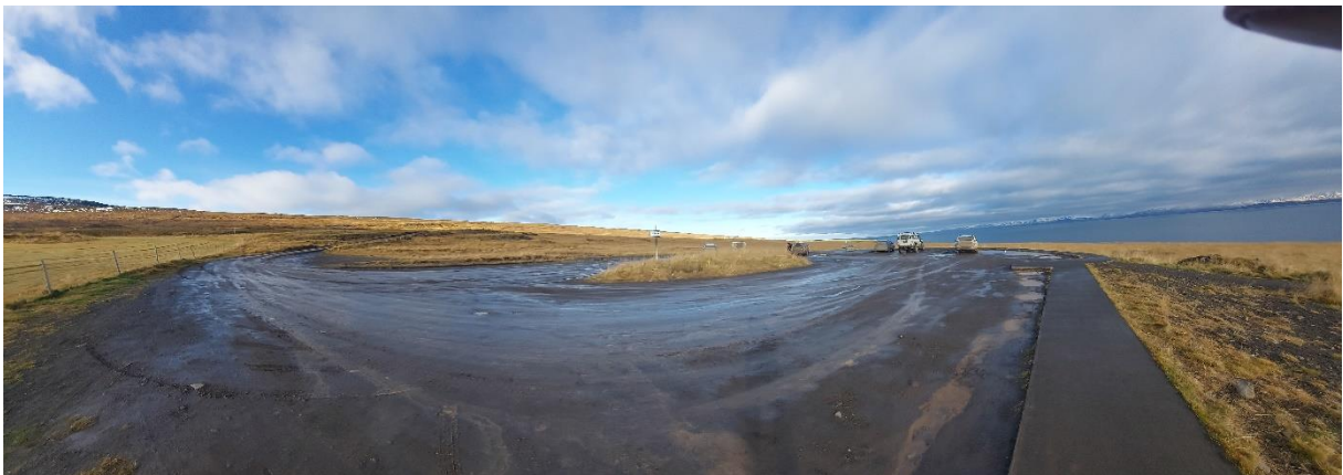
Mynd 5. Bílastæði við Hvítserk, mynd frá 2022.